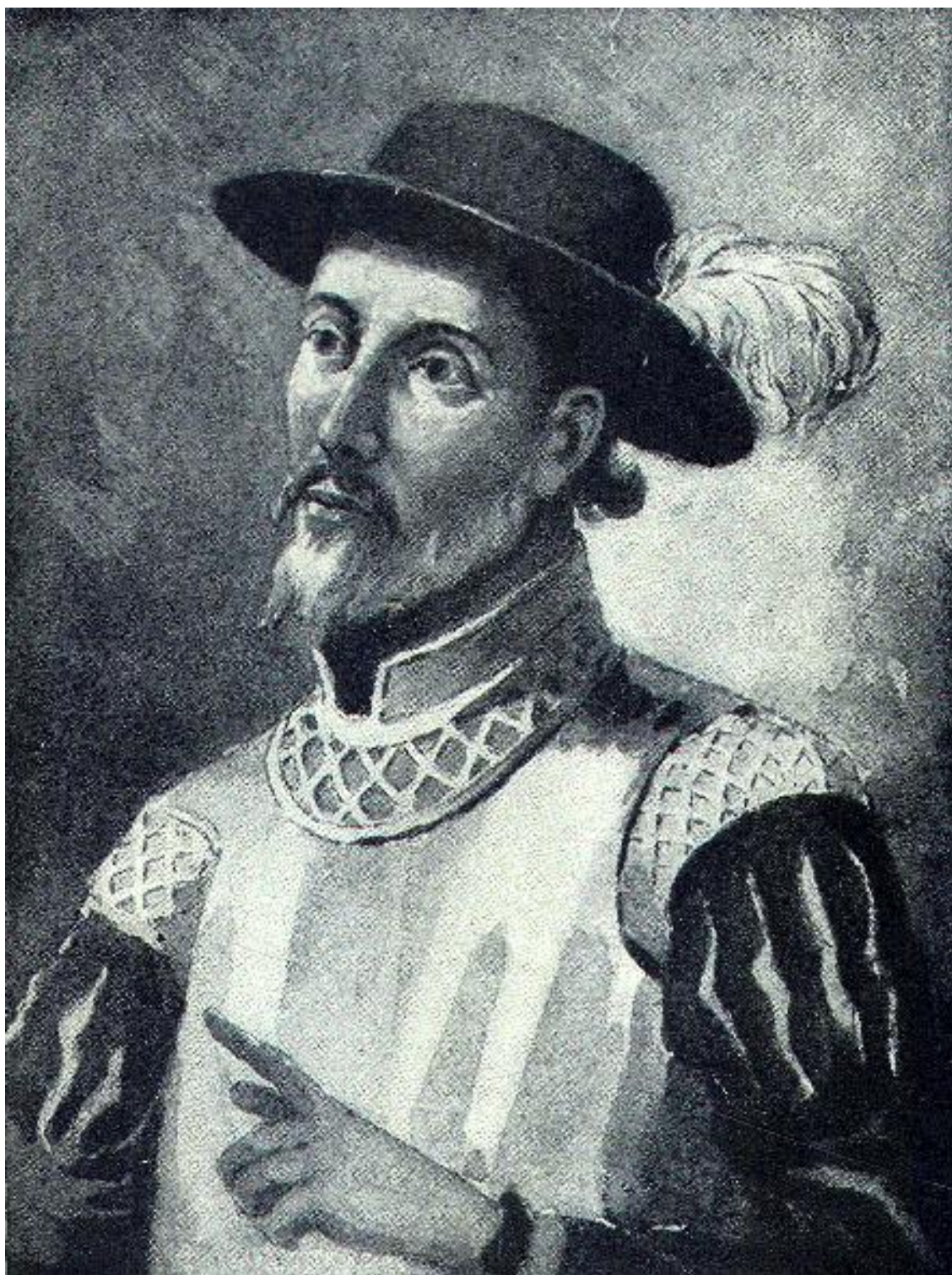
Педро Понсе де Леон (1508-1584)