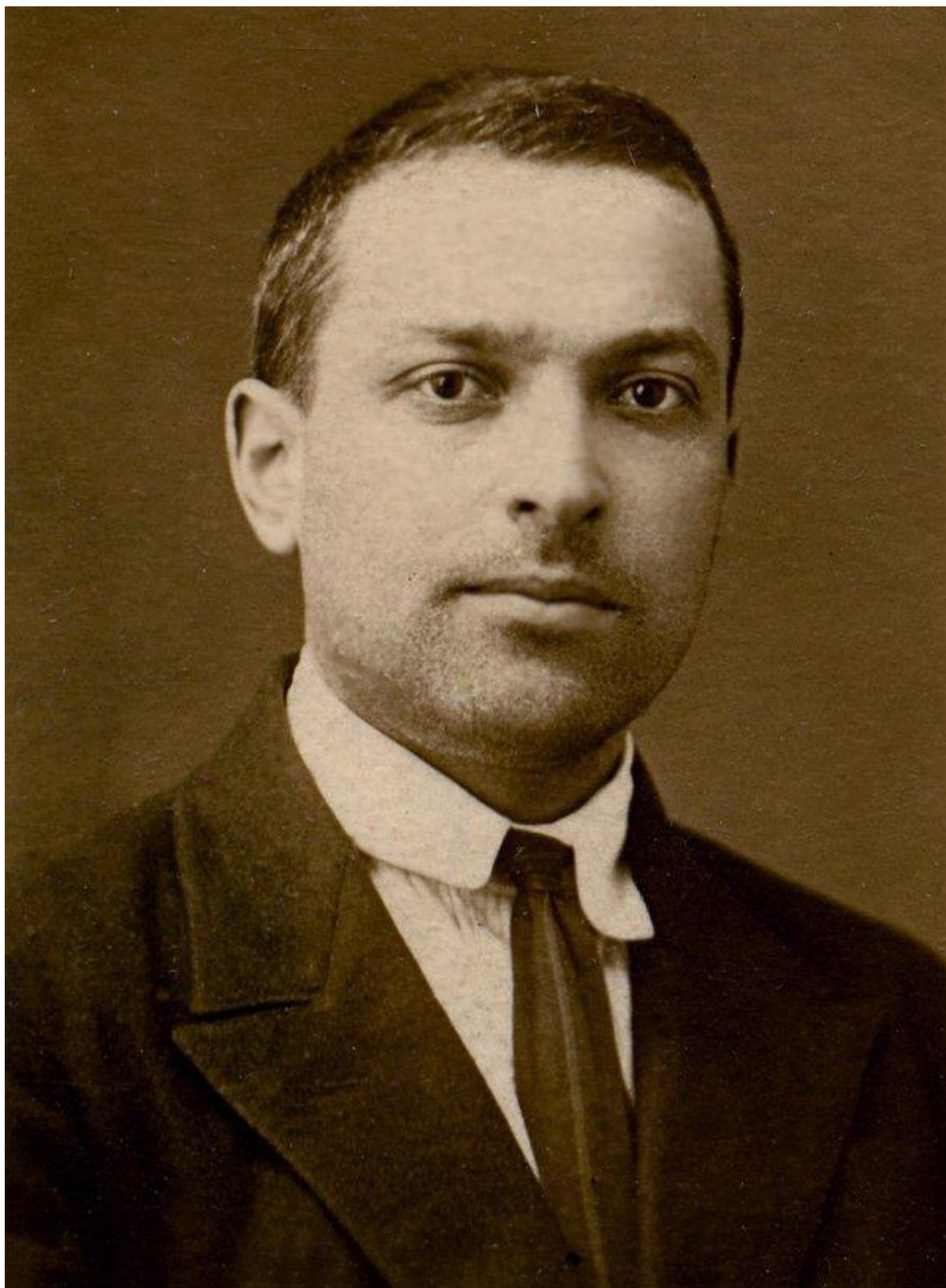
Выгóтский Лев Семёнович (1896 - 1934) - советский психолог