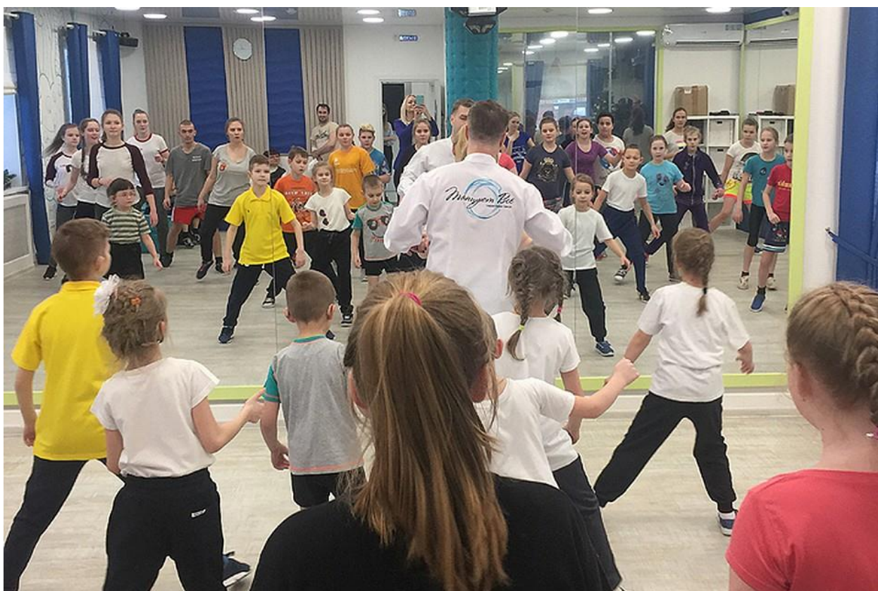
Проект «Танцующие в тишине» Барнаул