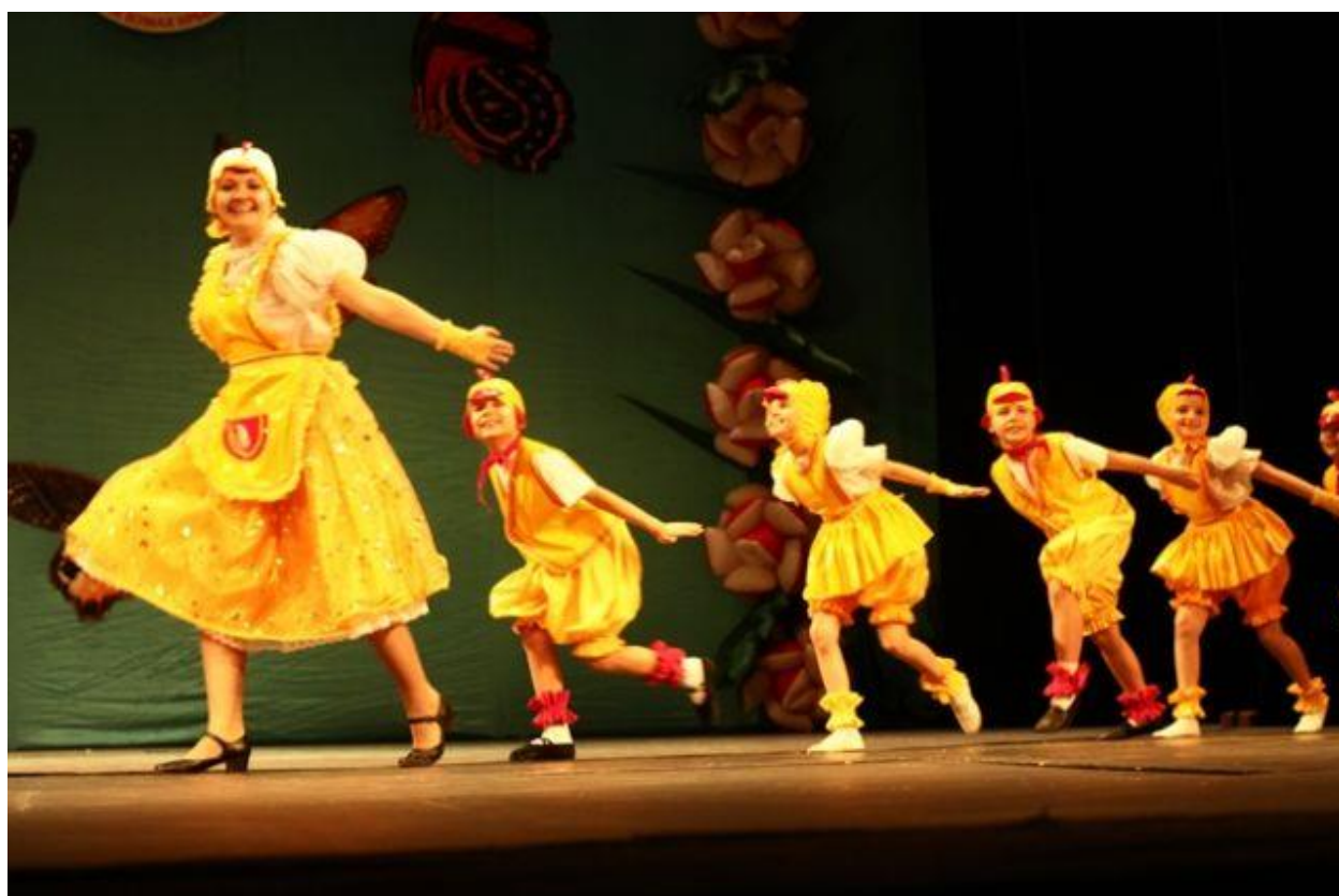
Конкурс танцев «Глухихнет» г. Волгоград