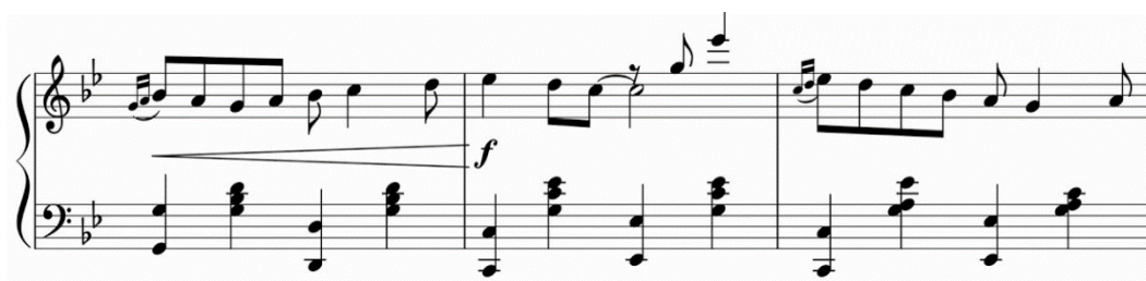
Рисунок 2 - Регтайм «Magnetic Rag»

Для доказательства третьей характерной черты мы предлагаем рассмотреть фрагмент (рисунок 2) одного из последних регтаймов «Magnetic Rag» Скотта Джоплина, написанного им и опубликованного в 1914 году. Без труда мы замечаем характерную для регтайма фактуру – бас-аккорд.