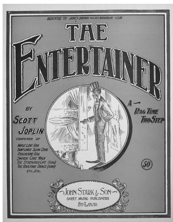
Рисунок 4 - Обложка первого издания регтайма Скотта Джоплина «Артист эстрады»

Скотт Джоплин написал 44 регтайма. Самыми известными из них являются «Артист эстрады» (1902) и «Кленовый лист» (1899). Регтайм являлся неотъемлемой частью салонной музыки. Позже регтайм наравне с блюзом повлиял на появление джаза. Увлечение регтаймом было связано с таким танцем, как кэйкуок [Смурова, 2010]. Важной деталью роста популярности регтайма является то, что проводилось много конкурсов регтайма, появились даже разные школы регтайма. Издавались ноты, учебная литература, книги, посвященные регтайму. На рисунке 4 изображена обложка первого издания регтайма Скотта Джоплина «Артист эстрады»: