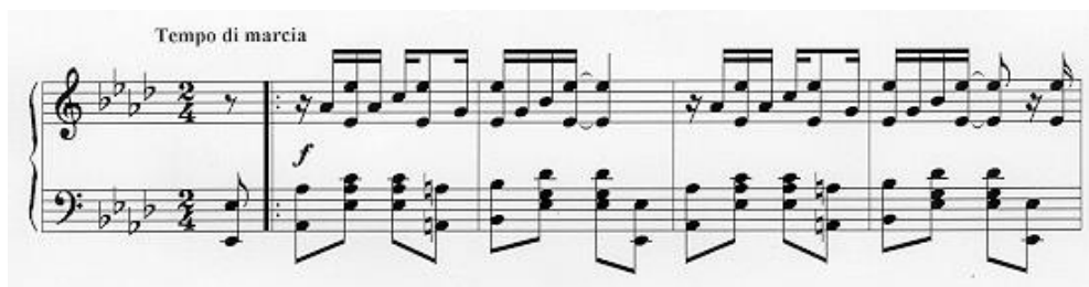
Рисунок 1 - Регтайм «Кленовый лист»

Данным примером подтверждается и вторая характерная черта регтайма. Музыкальный размер в данном музыкальном жанре может быть только двудольным (2/4, 4/4 и др.).