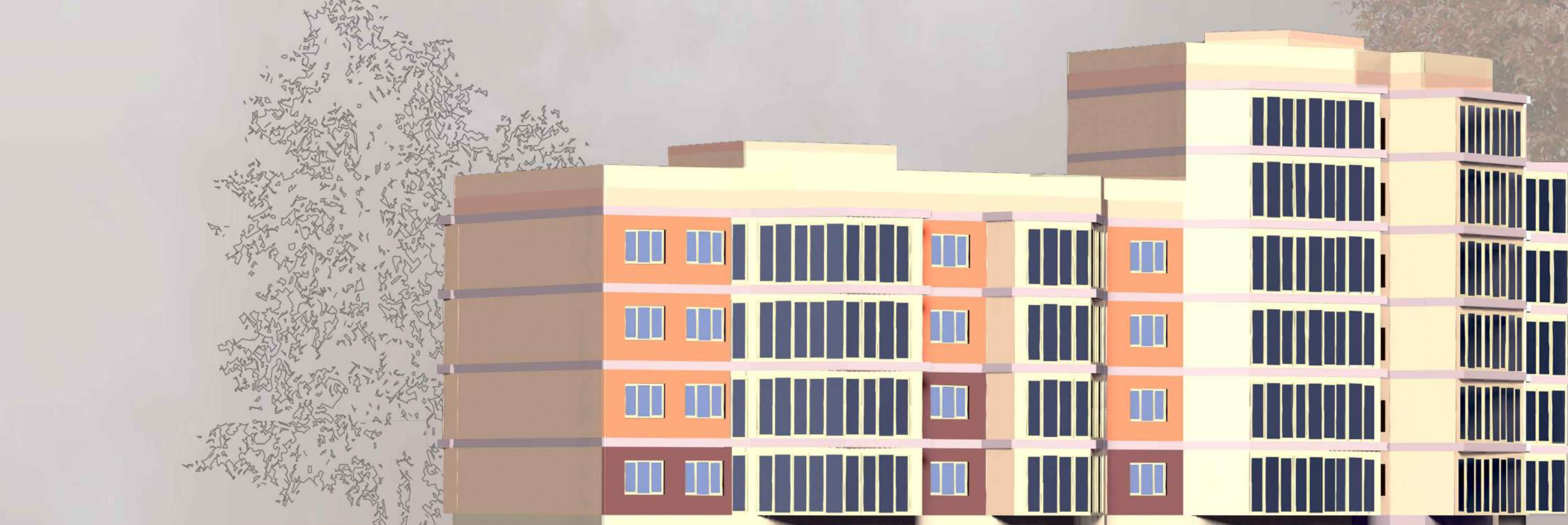
Боковой Фасад М 1:200