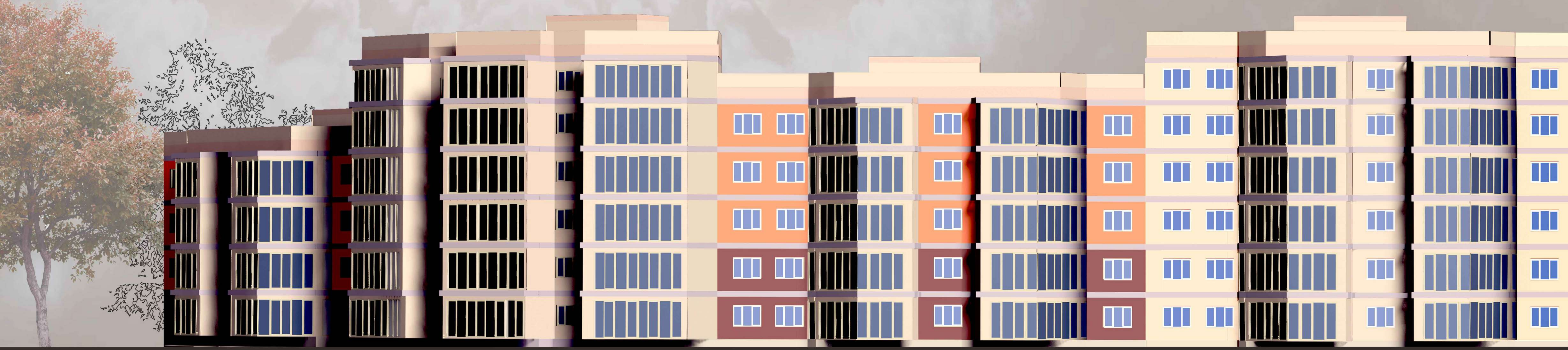
Главный фасад М 1:150