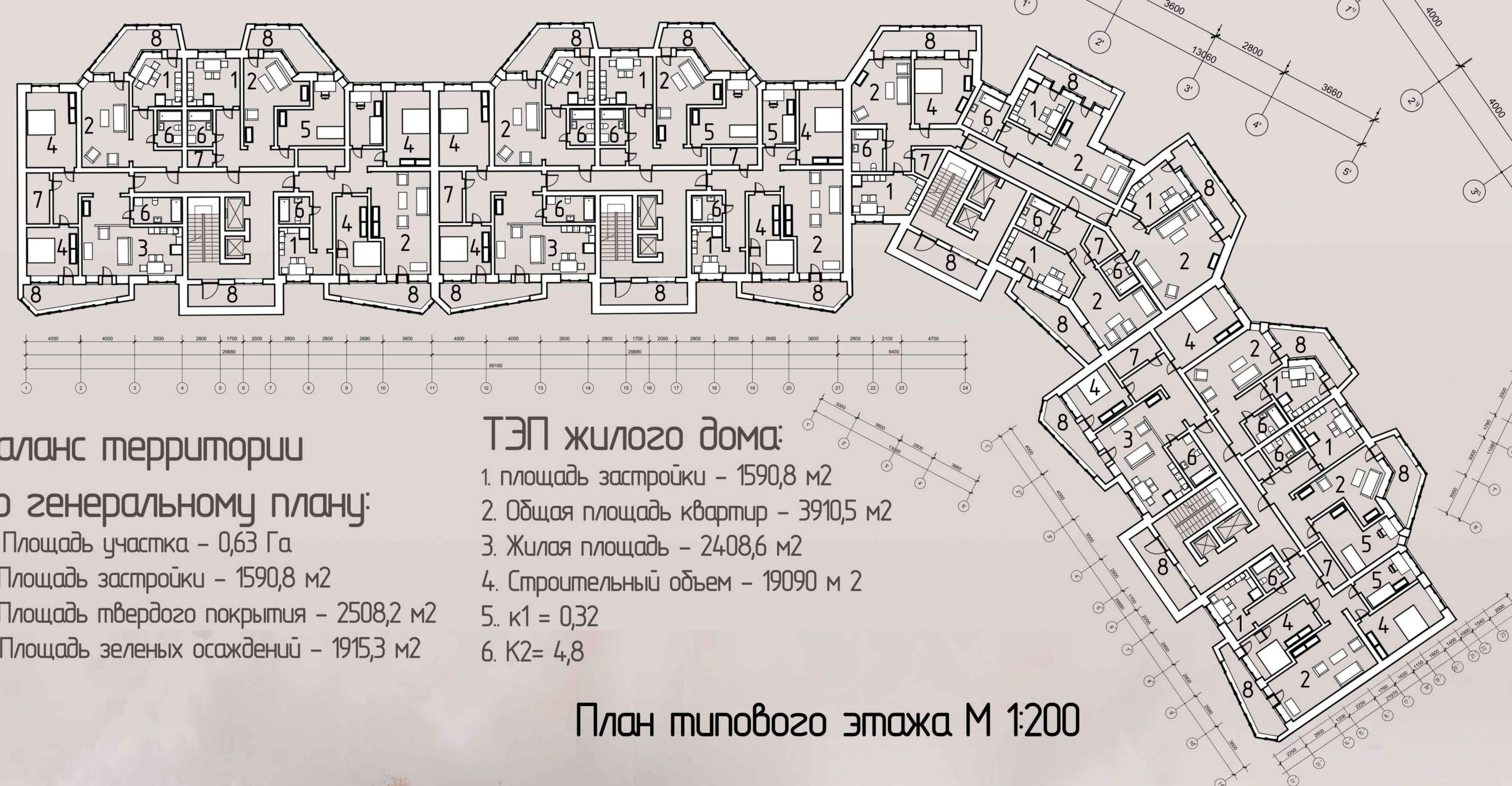
План типового этажа М 1:200