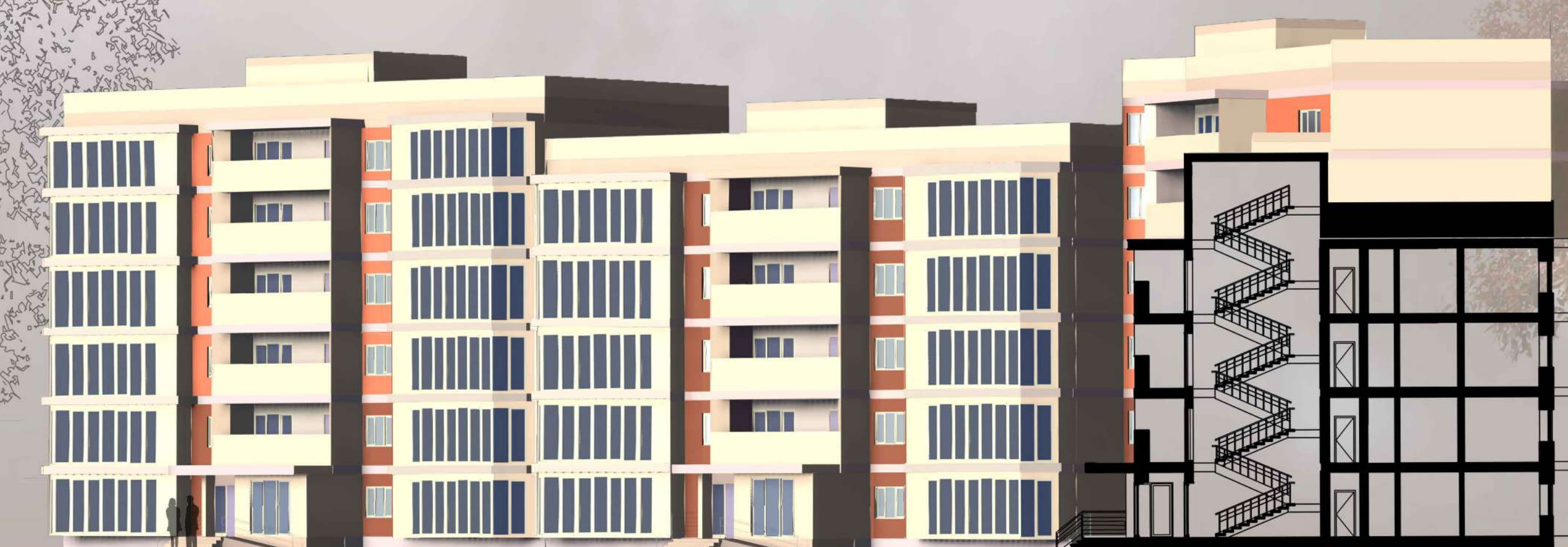
Разрез М 1:200