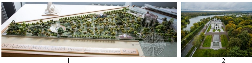
Рис. 1. Приусадебная территория дома-музея М.В. Асеева в г. Тамбове: 1 – макет фонтанного парка усадьбы Асеевых после реконструкции, 2 – вид на главную парадную площадь

Дом-музей в стиле модерн был построен по проекту Л.Н. Кекушева в 1905 г., его отличительными чертами были тонкая проработка деталей, декоративное разнообразие, высокое качество строительных работ [2]. Усадебный комплекс после реконструкции включал дом-особняк, кафе, павильон с минеральным источником, зелёные галереи и аллеи, открытый амфитеатр с санитарными узлами, детскую игровую зону, беседку, 11 фонтанов, что изображено на макете (рис. 1-1).