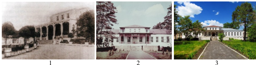
Рис. 5. Усадьба Загряжских-Строгановых:

кирпичная стена, которая огораживала усадьбу и садовую зону с плодоносящими деревьями и кустарниками. Сад тянется до ивовой аллеи, за которой начиналось поле.