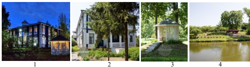
Рис. 4. Музей-усадьба С.В. Рахманинова:

Музей-усадьба композитора С.В. Рахманинова находится в с. Ивановка Уваровского района (рис. 4). Слева от входа в господский дом находится березовая аллея, а справа – посадки сирени и роз. На территории усадьбы можно выделить молодой и старый парки. Старый парк состоял из Кленовой и Красной аллеей, проложенных параллельно друг другу, с уютной деревянной беседкой и садовым домиком. В местах оврагов образовались два пруда, соединённых мостиком. В уютных, уединенных местах парка располагаются многочисленные беседки различной конфигурации. Перед усадебным домом под небольшим навесом находится дворовый колокол. В настоящее время практически полностью удалось восстановить все постройки и сохранить растительность садово - парковой зоны.