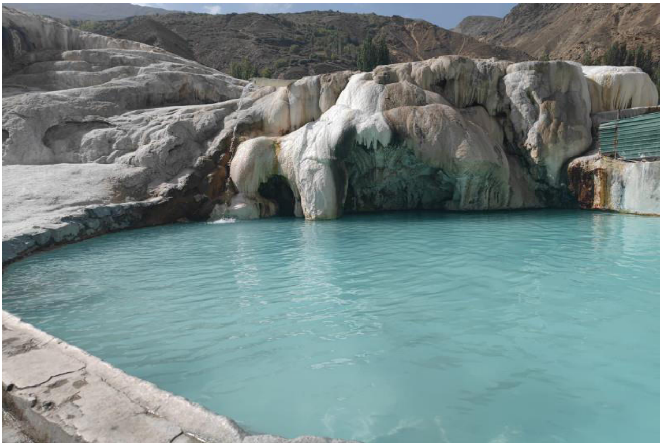
Рис. 9. Гарм Чашма (горячие источники-ГБАО-Памир).