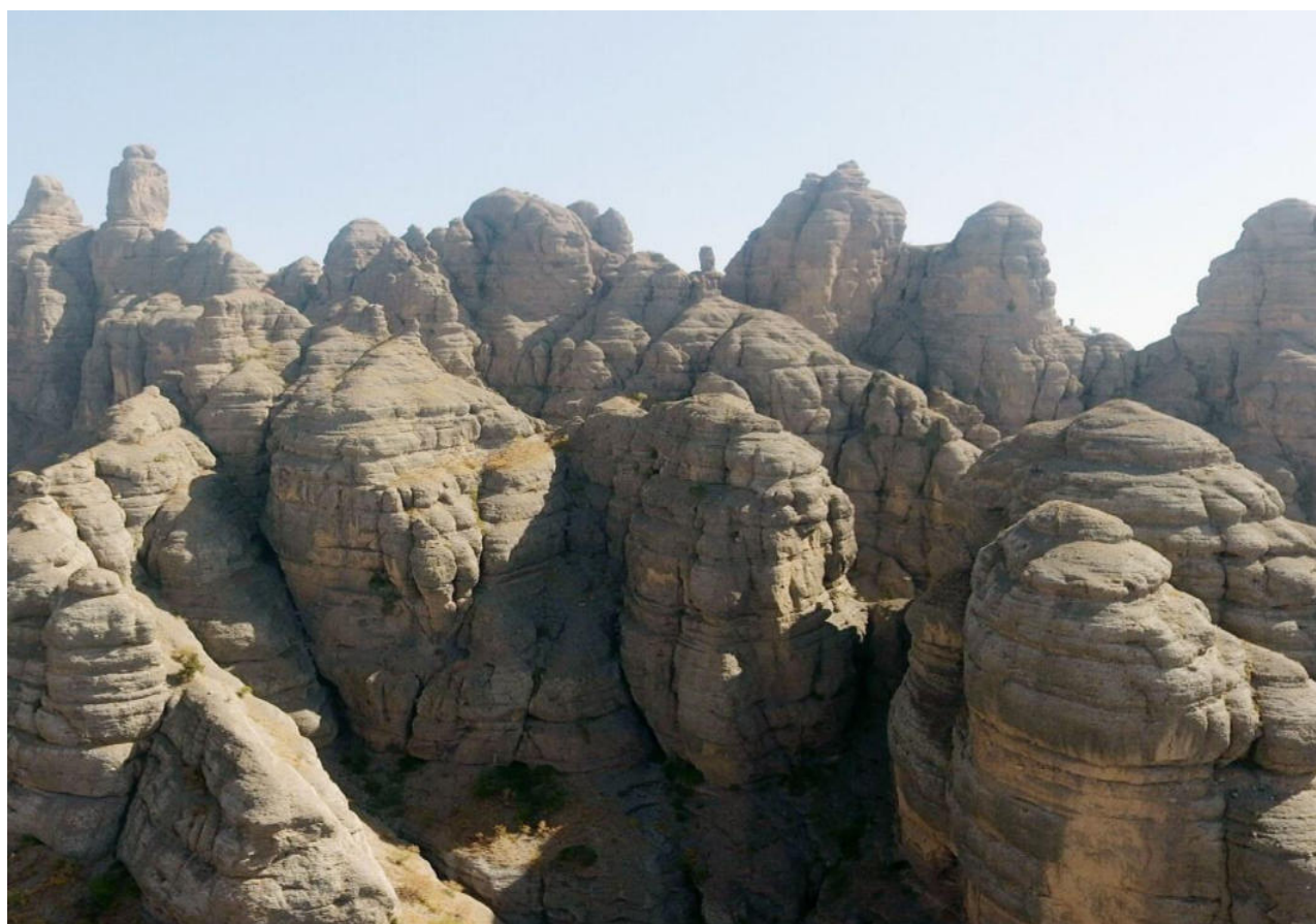
Рис. 1. Оазис «Чилдухтарон»( Сорок девушек).