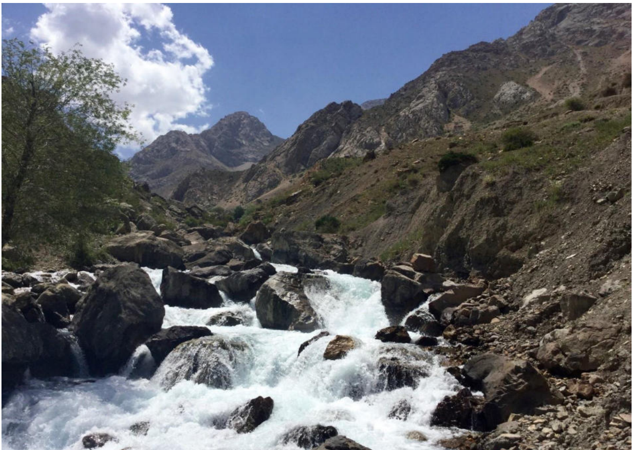
Рис. 11. Рамитское ущелье.