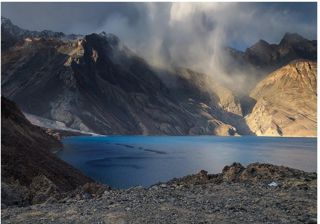
Рис. 7. Озеро Сарез (ГБАО-Памир).