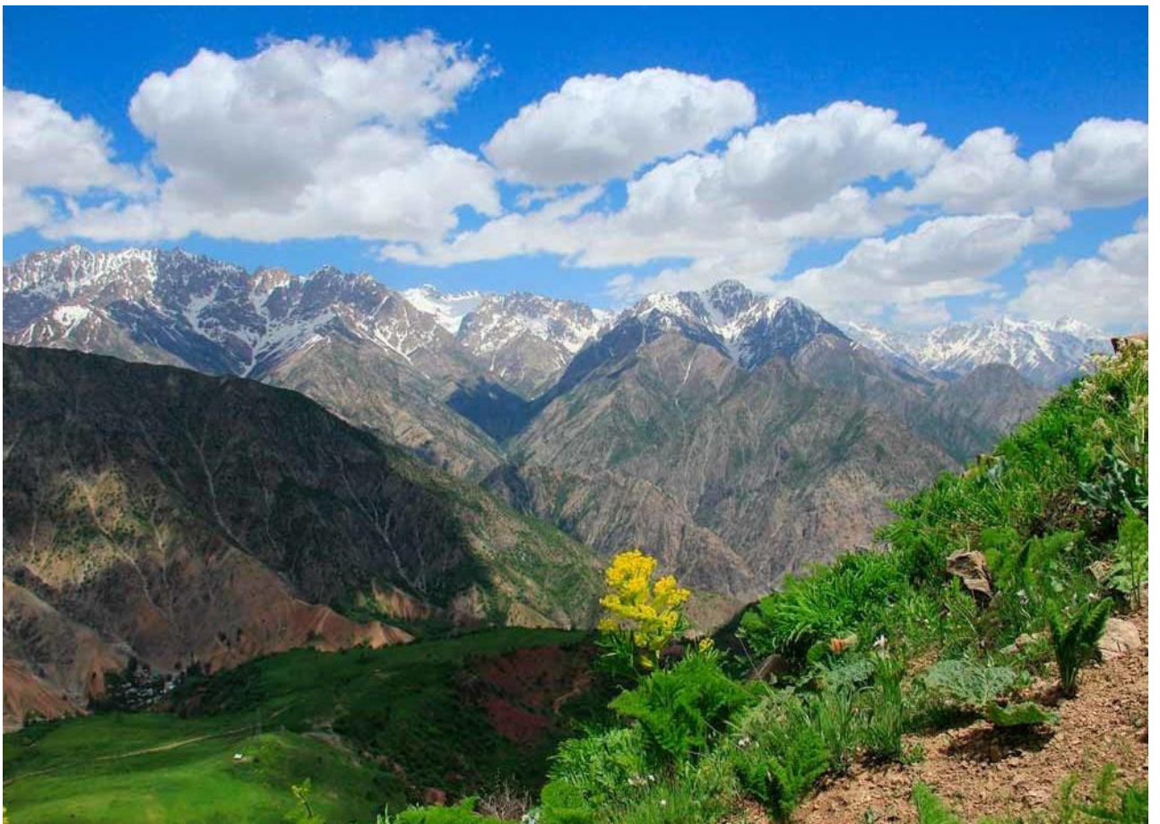
Рис. 10. Варзобское ущелье.