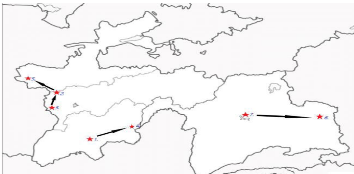
1 – Чилучор Чашма (44 озера)

Для того, чтобы наглядно представить мой туристический маршрут, я стала работать с картой Таджикистана. Нашла вышеописанные места. И разработала несколько маршрутов, нанеся стрелки на карту Таджикистана. Используя интернет-информацию об этих местах, составила текст - описание, которое использовала для виртуальной экскурсии по слайдам для учеников начальной школы.