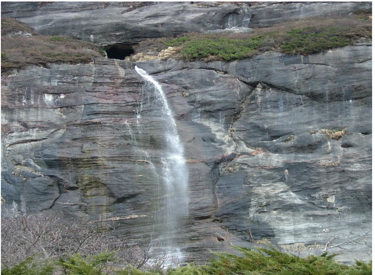
Рис. 6. Пещеры Мата – Таш (ГБАО-Памир).