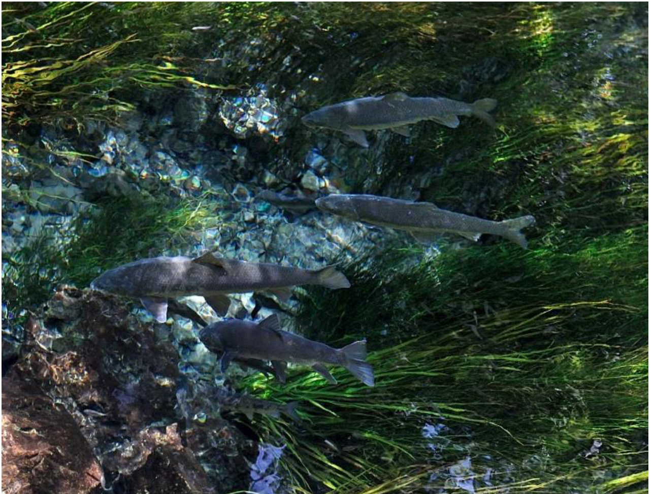
Рис. 4. Родники «Чилучор чашма» (Сорок родников).