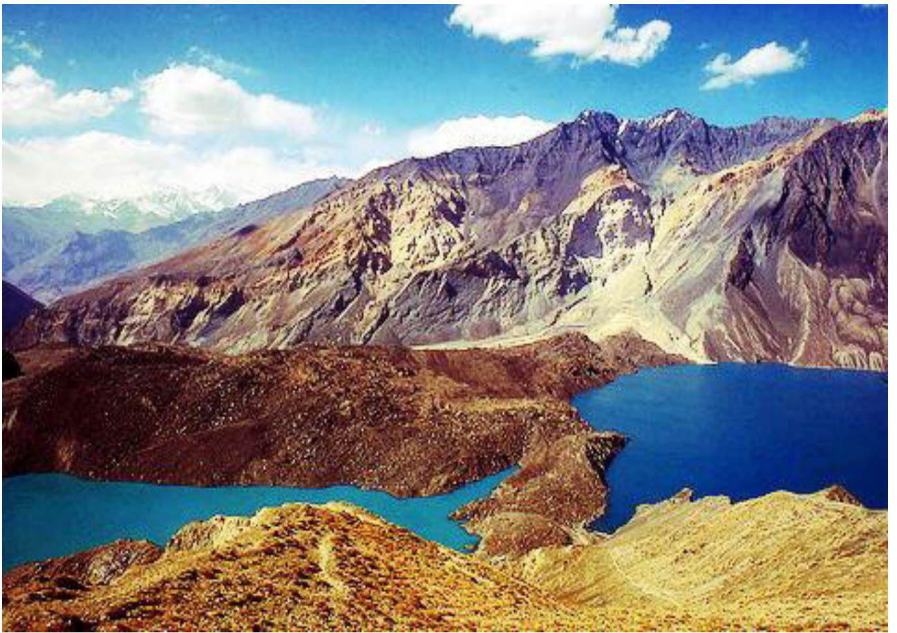
Рис. 8. Озеро Сарез (ГБАО-Памир).