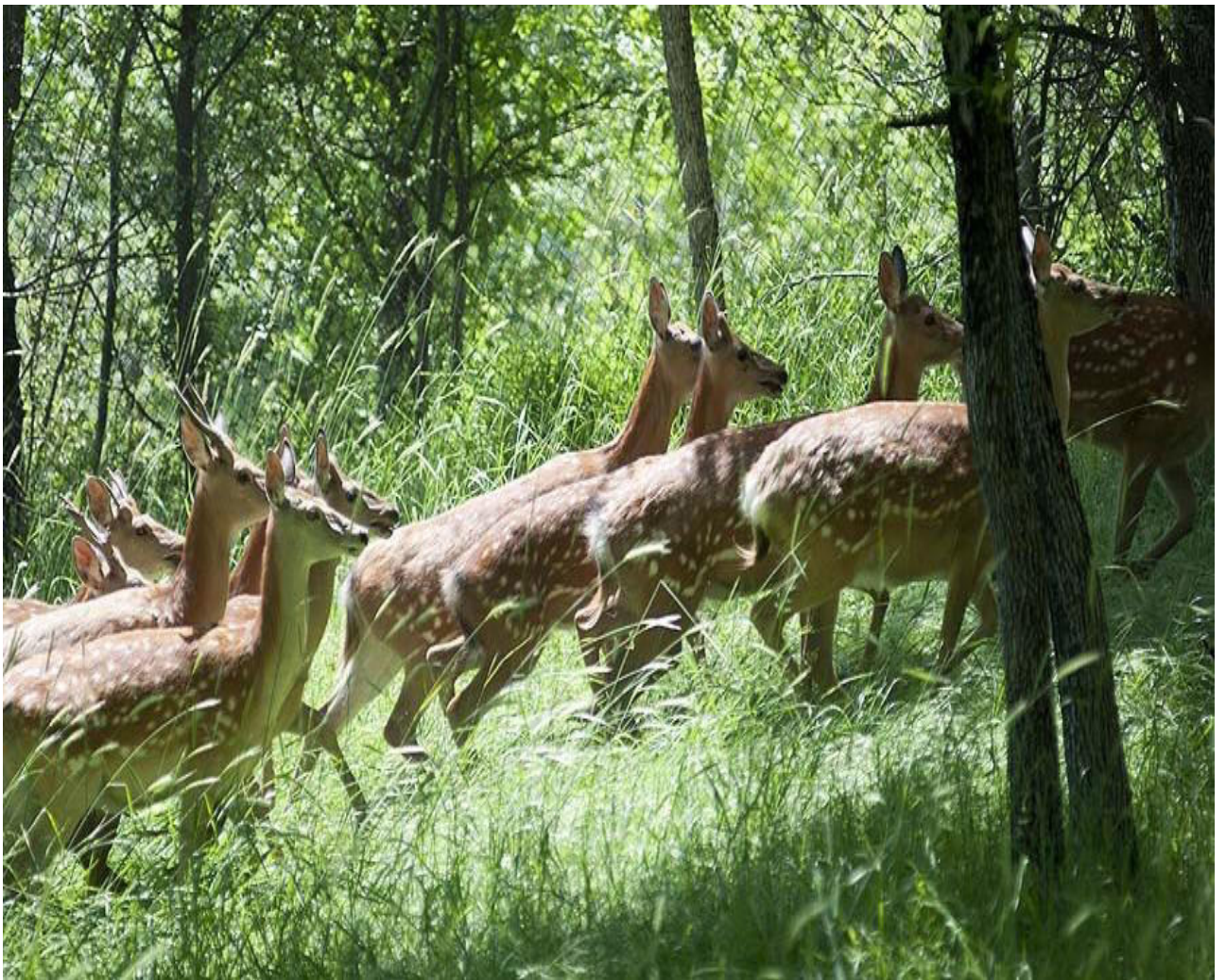
Рис. 2. «Историко-природный парк – Ширкент».