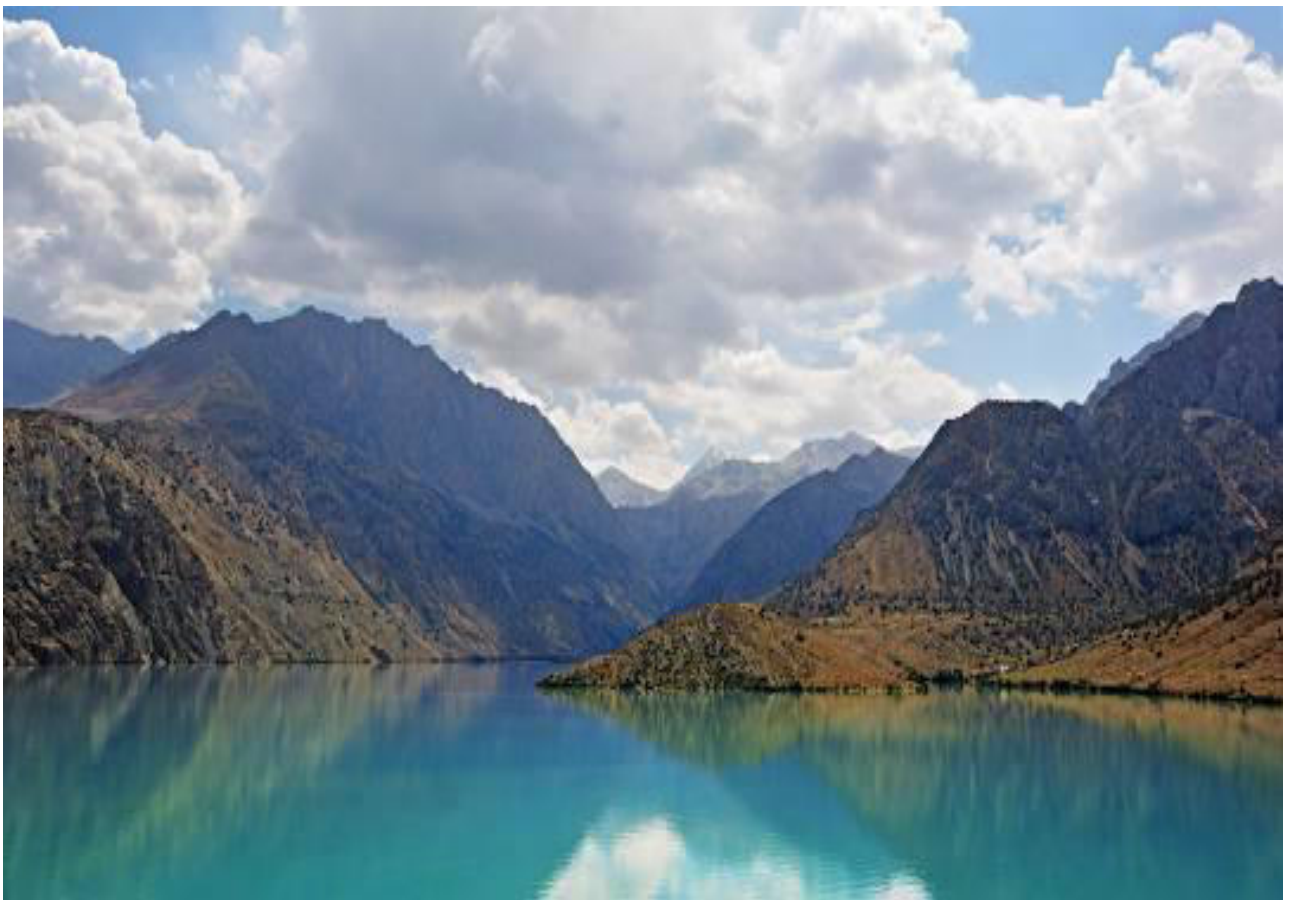
Рис. 3. Озеро «Искандеркуль».