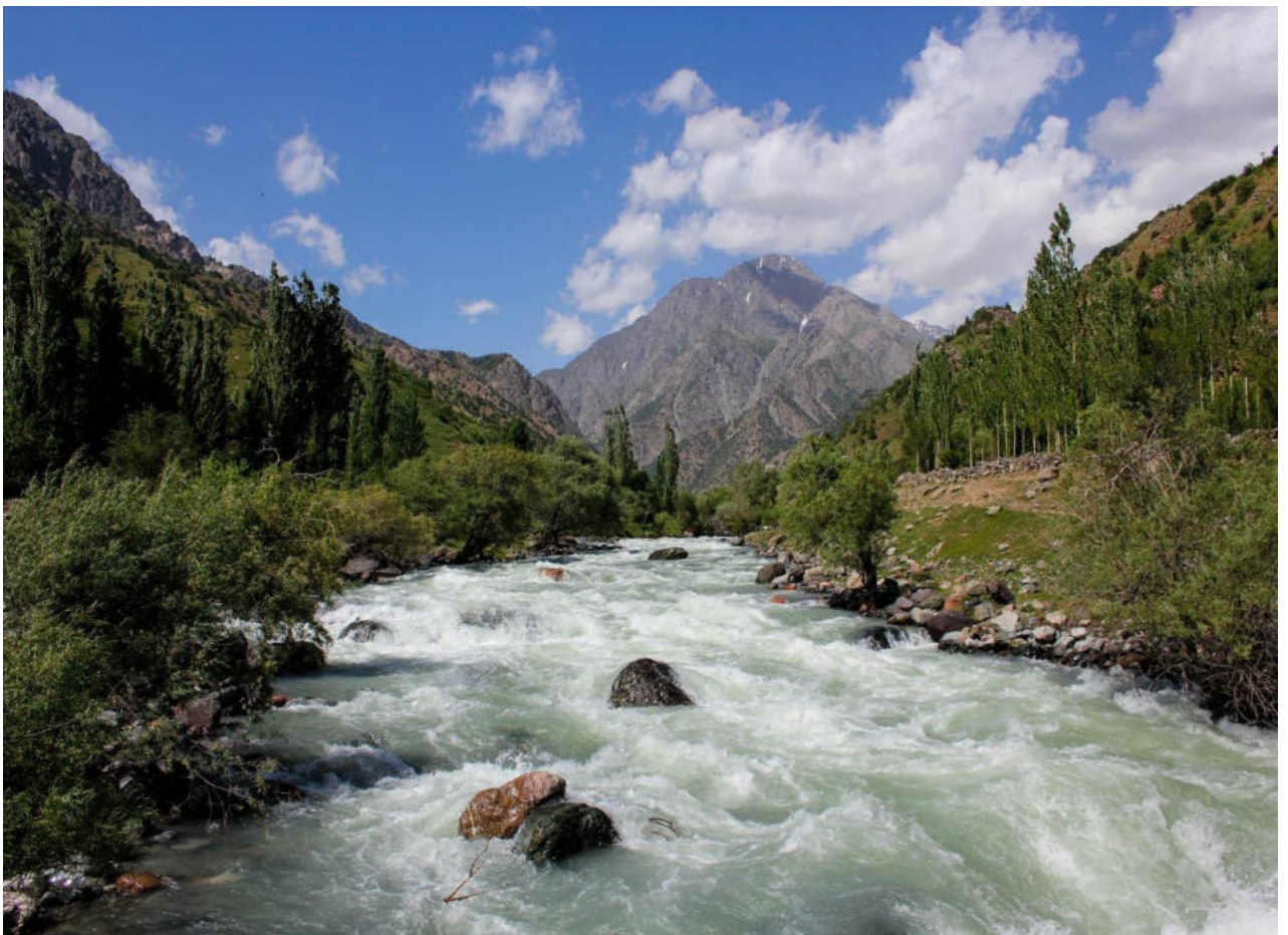
Рис. 12. Озеро Тимур дара речка Каратаг (город Турсунзаде).