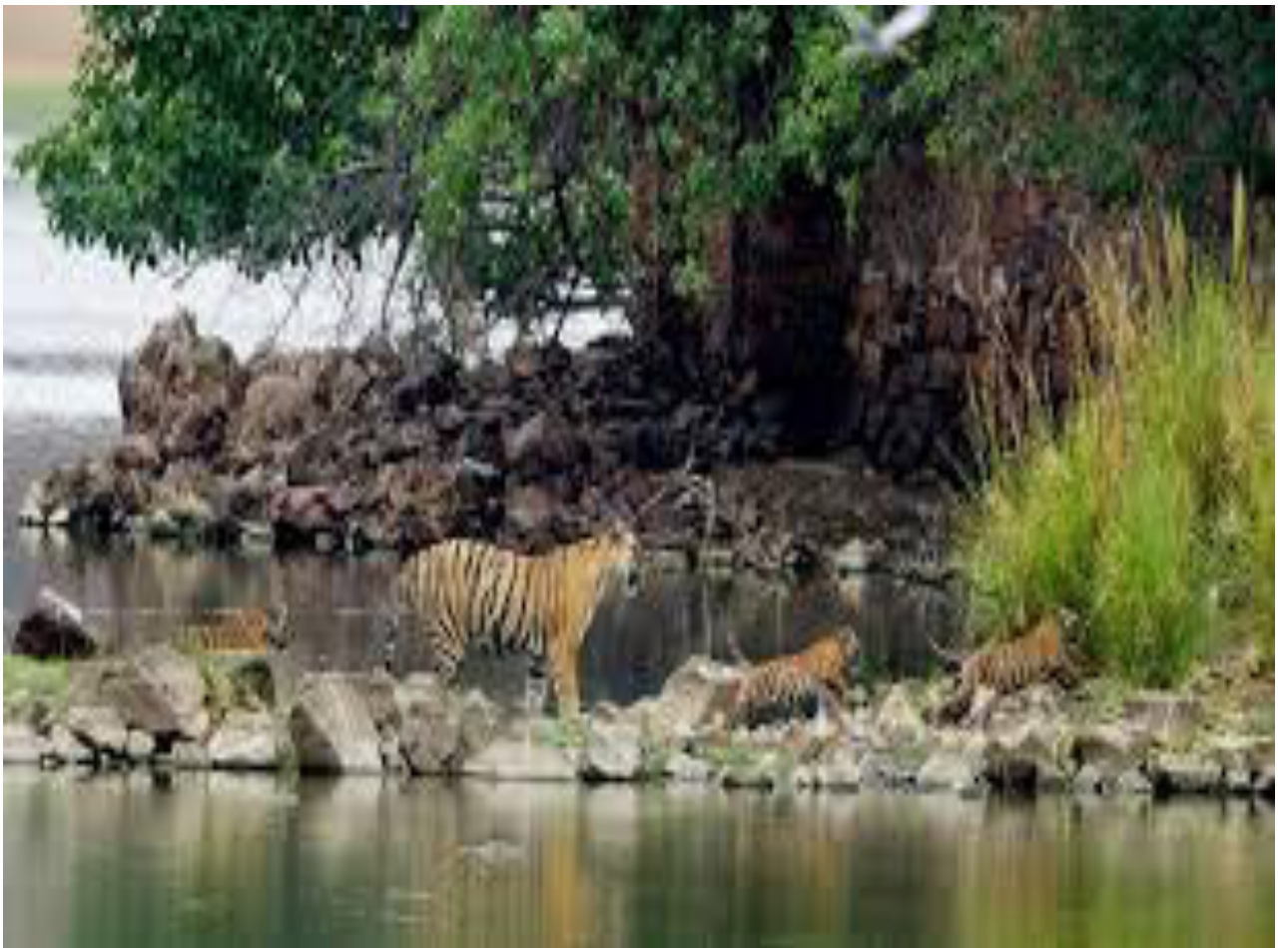
Рис. 13. «Тигровая балка» (Хатлонская область, Республика Таджикистан).