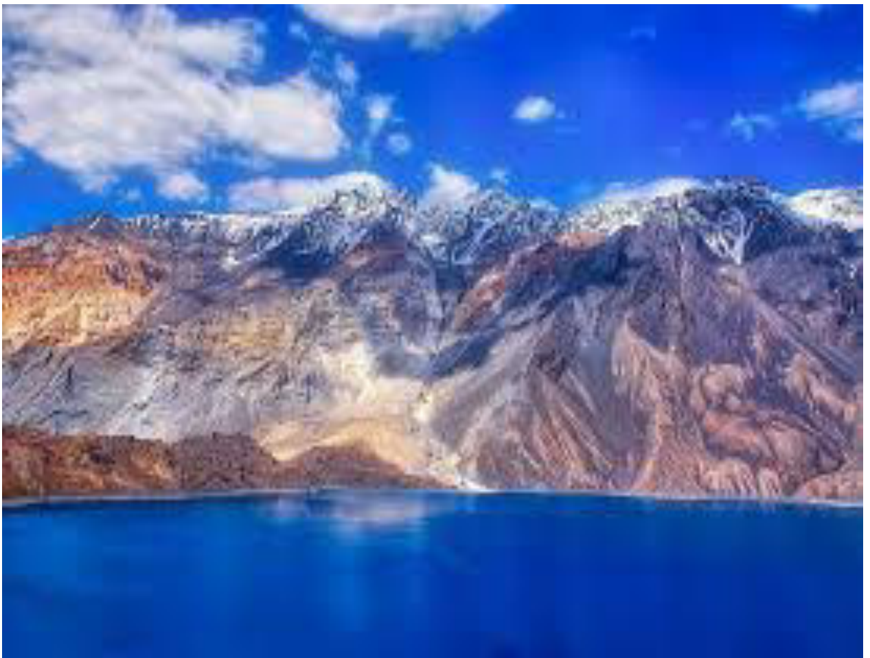
Рис.5. Маргузорские озера (Хафткул)