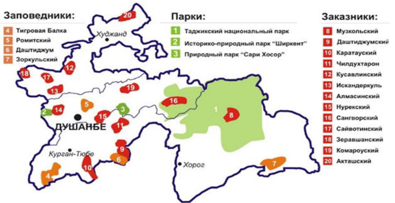
Рис. 14. Заповедники, парки и заказники Республики Таджикистан.